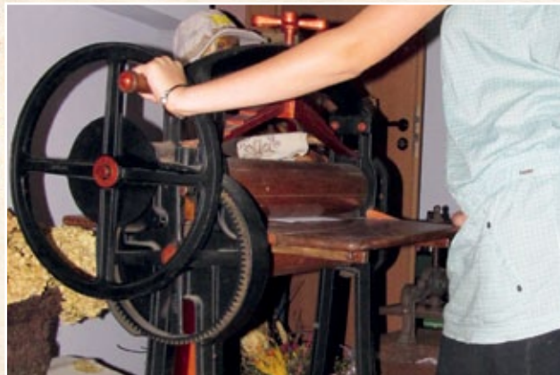
CELEJÓW (gm. Wąwolnica)

Celejów 72A, 24-160 Wąwolnica wokolbystrej@o2.pl tel. 695 137 072, 693 533 545