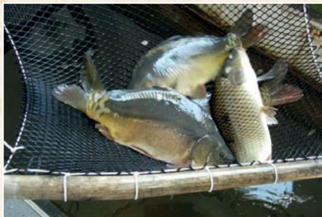
TRZEBIESZA (gm. Opole Lubelskie)

Trzebieszka 69, 24-320 Poniatowa www.pstragpustelnia.pl kontakt@pstragpustelnia.pl, tel. 667 449 395