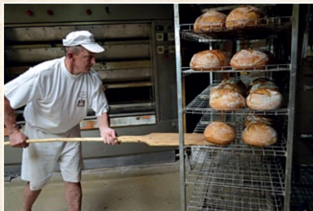
KRACZEWICE Prywatne (gm. Poniatowa)

Kraczewice Prywatne 26, 24-320 Poniatowa piekarnia.tzubrzycki@onet.pl tel. 81 820 42 82