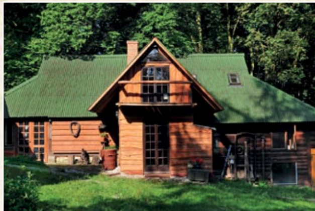
CHOLEWIANKA (gm. Kazimierz Dolny)

Cholewianka 60, 24-120 Kazimierz Dolny www.wiatrakowo.pl kontakt@wiatrakowo.pl, tel. 606 667 186